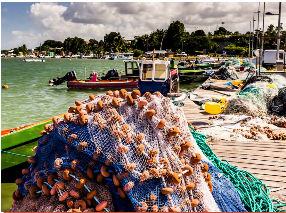
Port de Sainte-Rose, Guadeloupe