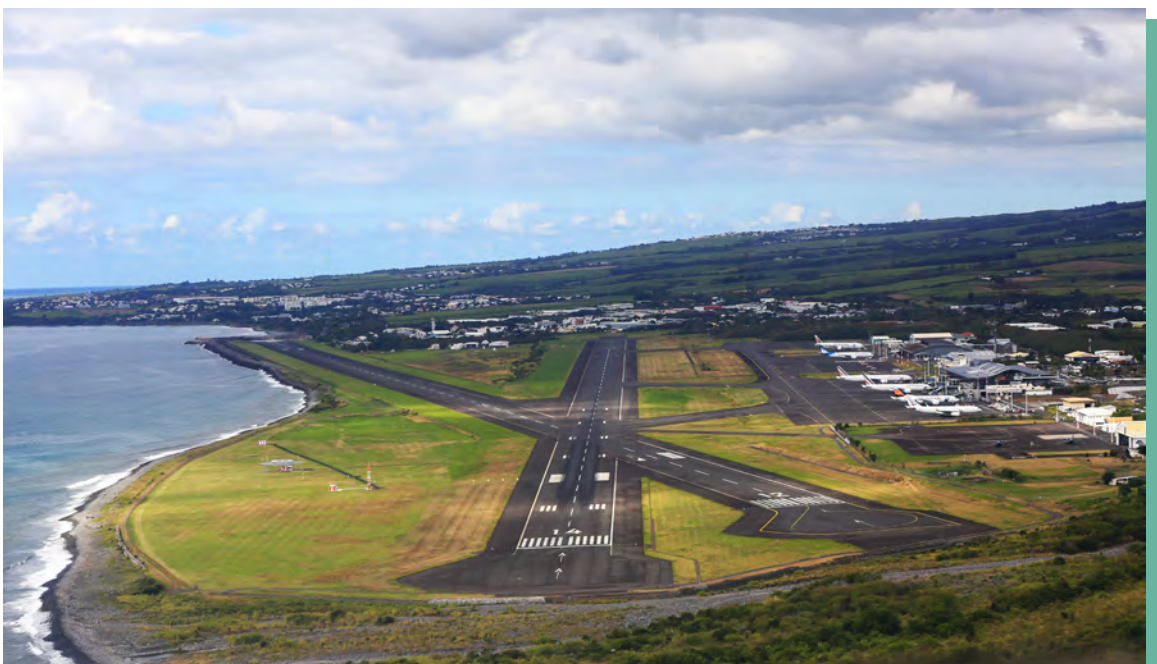
Aéroport de Saint-Denis de La Réunion