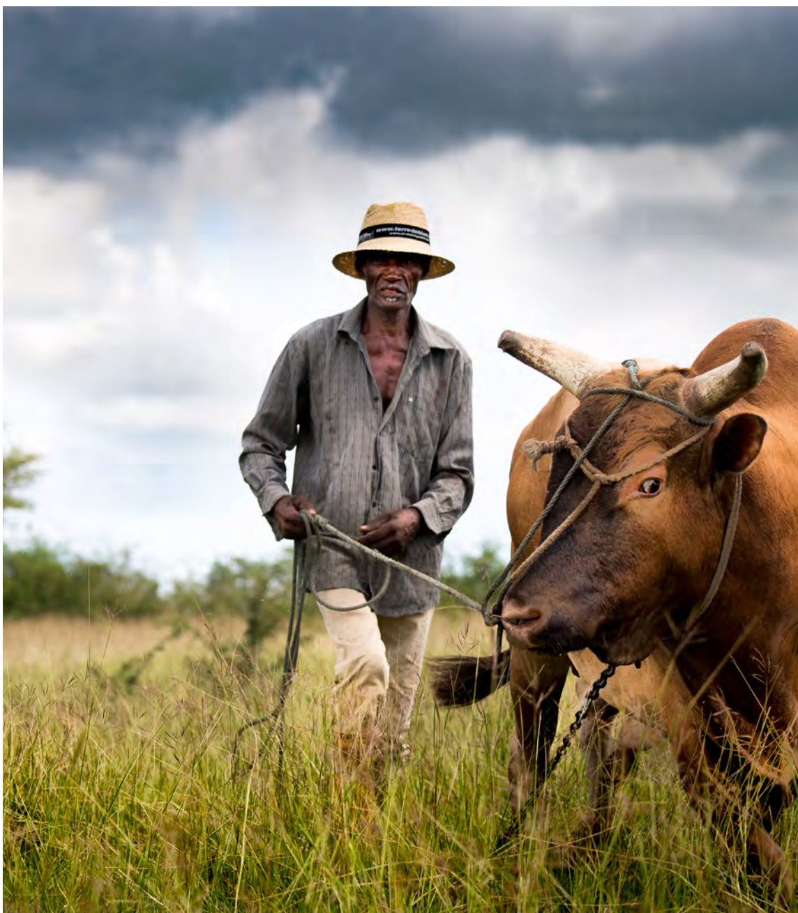
Agriculteur à Marie-Galante en Guadeloupe