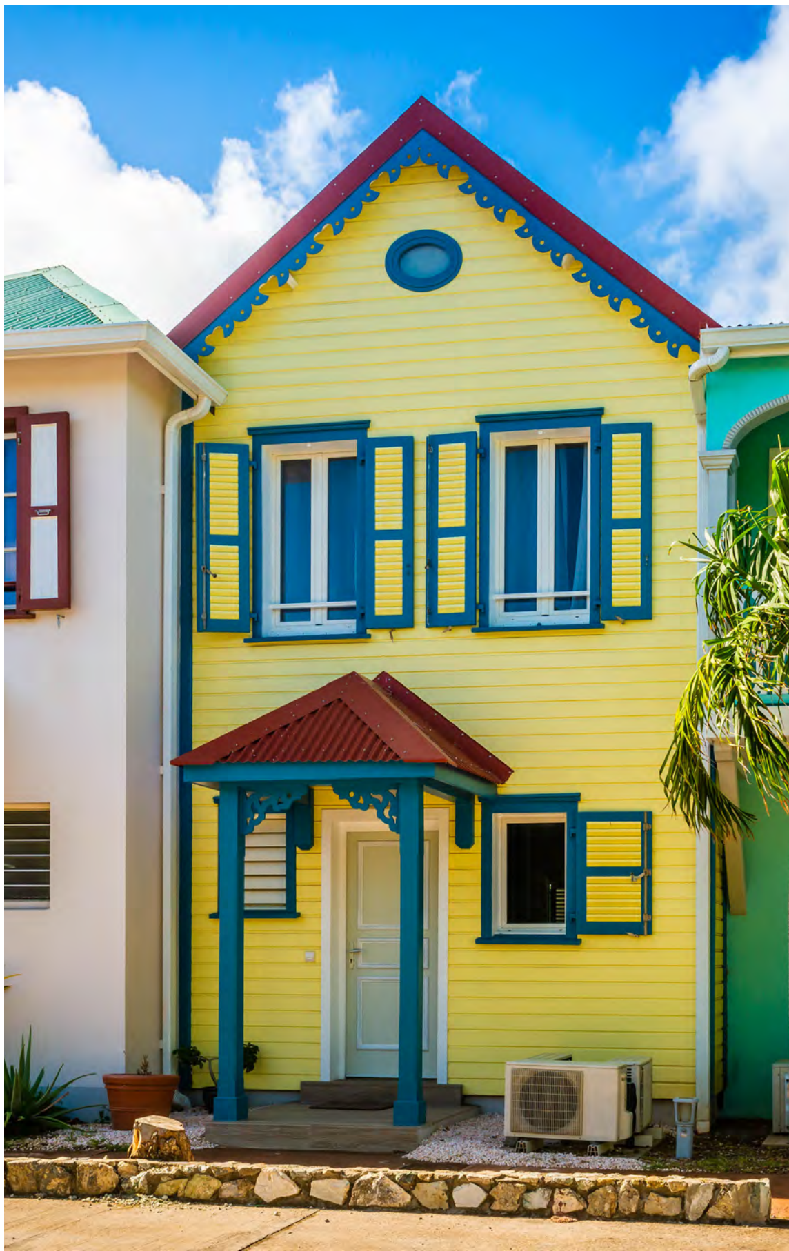
Habitations dans la baie orientale Saint-Martin