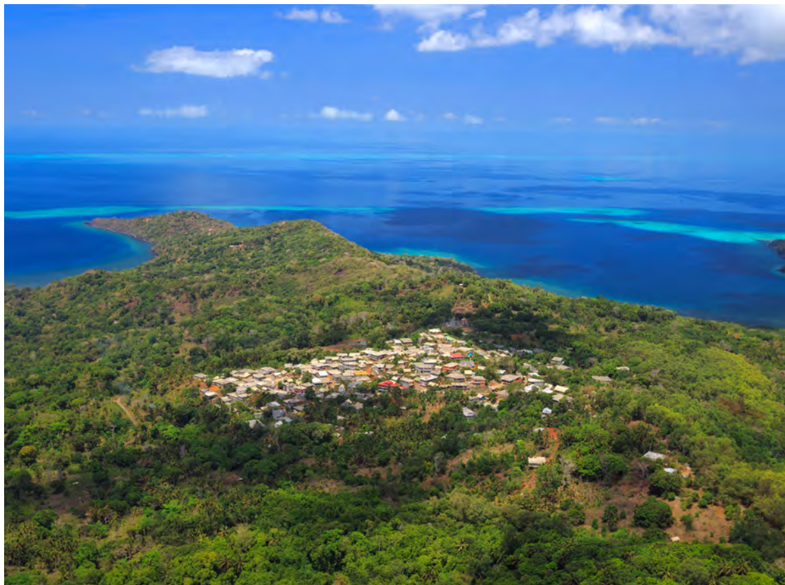
Adapter le droit pour qu'il réponde aux spécificités des territoires. Mont Choungui, Mayotte

La Première ministre donne également instruction aux membres du Gouvernement d'être attentifs à évaluer systématiquement l'impact dans les collectivités ultramarines (régions ultrapériphériques) des nouvelles propositions législatives de la Commission européenne, à proposer les adaptations nécessaires aux spécificités de ces collectivités en lien avec le ministère chargé des outre-mer, et demande au secrétariat général des affaires européennes (SGAE) de veiller au respect de cette mesure.