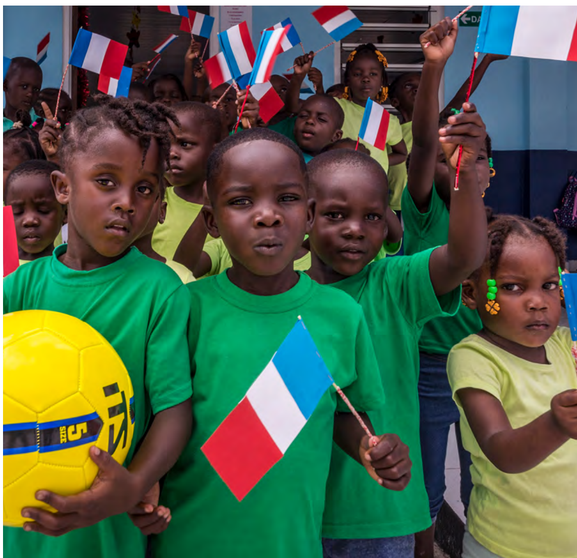
Élèves de l'école Beli Kampoe de Grand-Santi, Guyane