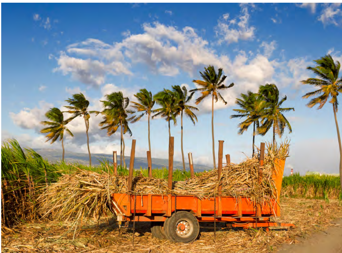
Récolte de canne à sucre, île de La Réunion