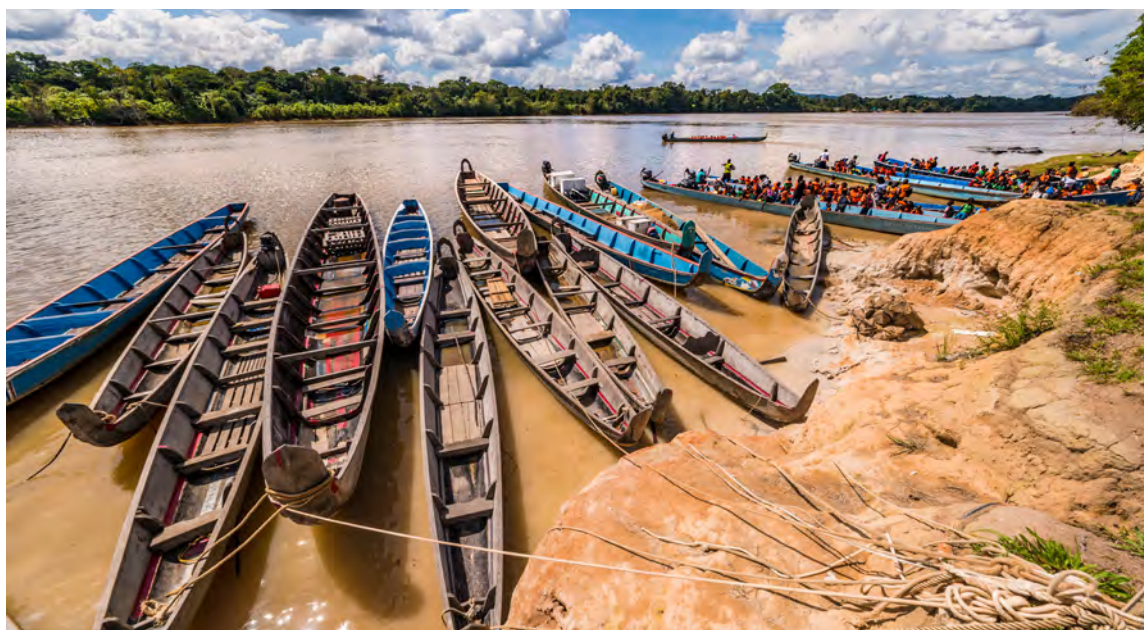
Fleuve Maroni, Guyane

Les étudiants qui souhaitent poursuivre leur formation dans un pays de leur environnement régional seront soutenus dans leur projet de mobilité. Le ministre chargé de l'enseignement supérieur et de la recherche facilitera les mobilités régionales à destination des jeunes, financées par INTERREG, à l'image du projet Échanges linguistiques et apprentissage novateur par la mobilité (ELAN) mis en œuvre en Martinique.